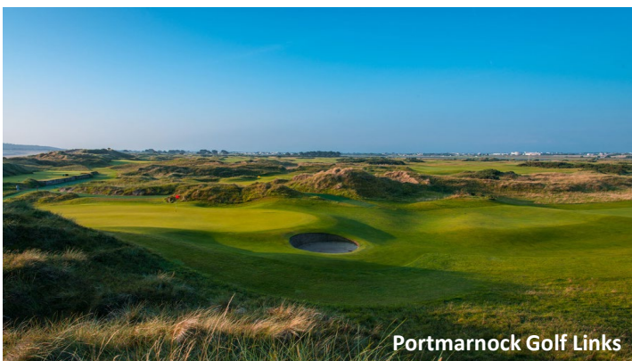
Portmarnock Golf Links