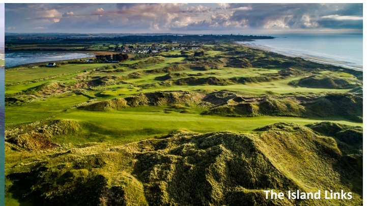
The Island Links