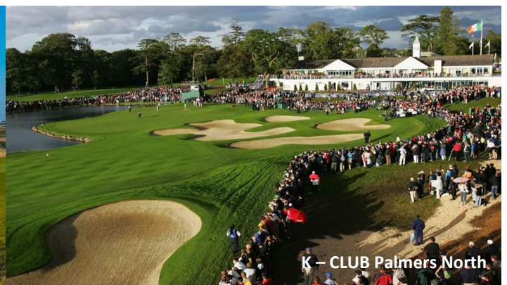
K - CLUB Palmers North