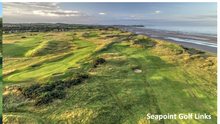
Seapoint Golf Links