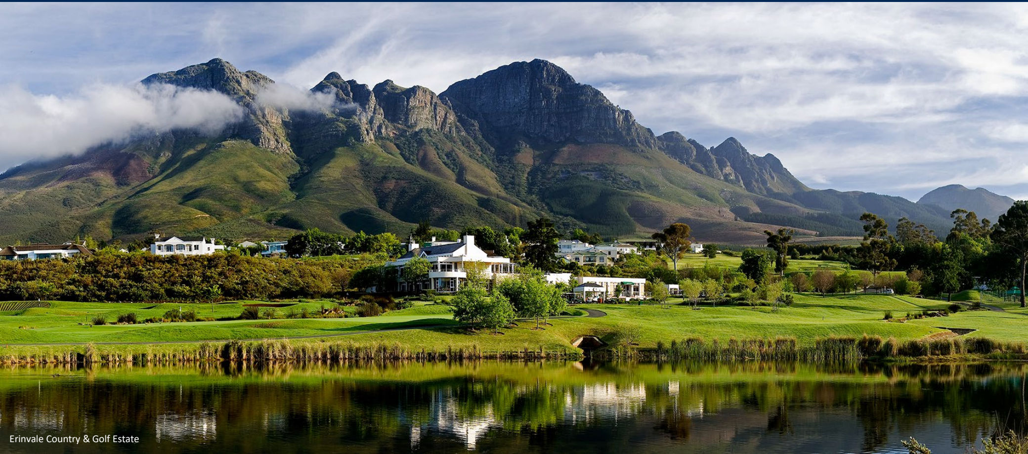
Erinvale Country & Golf Estate